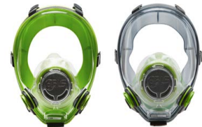
Vollmasken BLS 5700 - BLS 5600