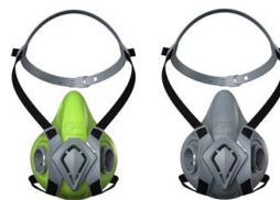
Halbmasken BLS 4000 ne»xt S - BLS 4000 ne»xt R