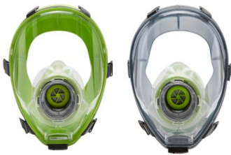
Vollmasken BLS 5400 - BLS 5150