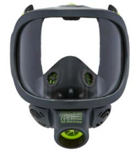
Vollmasken BLS 3150 - BLS 3150V