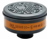
Filter BLS 400 Serie